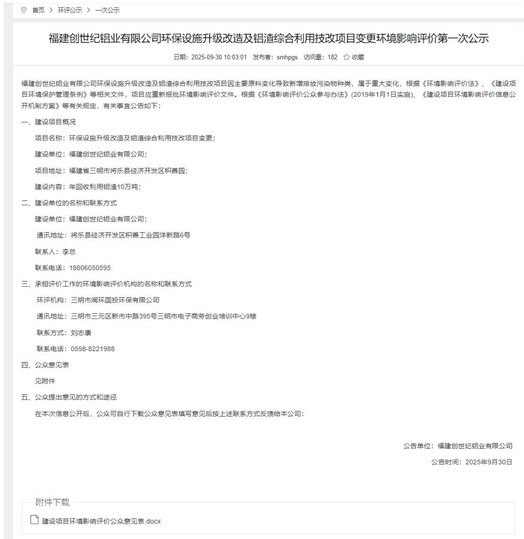
图 2.2-1 第一次网络公示

建设单位于 2025 年 9 月 30 日在“福建环保网”（网址： https://www.fjhb.org/huanping/yici/44781.html ）进行了“福建创世纪铝业有限公司环保设施升级改造及铝渣综合利用技改项目变更环境影响评价第一次公示”，公示截图见图 2.2-1。