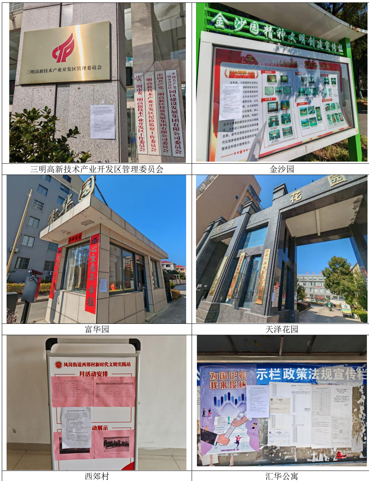
图 3.2.3 周边小区及村庄公示照片