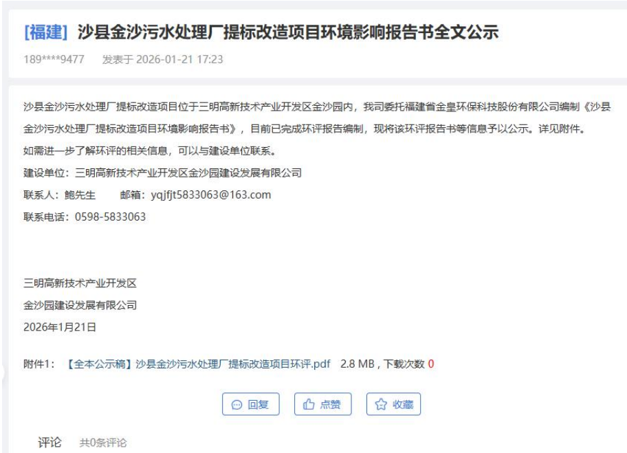
图 5.2.1 全国建设项目环境信息公示平台公示截图

三明高新技术产业开发区金沙园建设发展有限公司于 2026 年 1 月 21 日在全国建设项目环境信息公示平台（网址： https://www.eiacloud.com/gs/detail/1?id=60121X4Yfv ）进行了公示。公示截图如下：