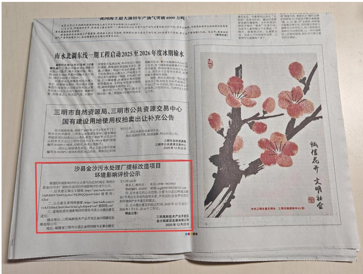
图 3.2.4 2025 年 12 月 22 日三明日报报纸公示图片