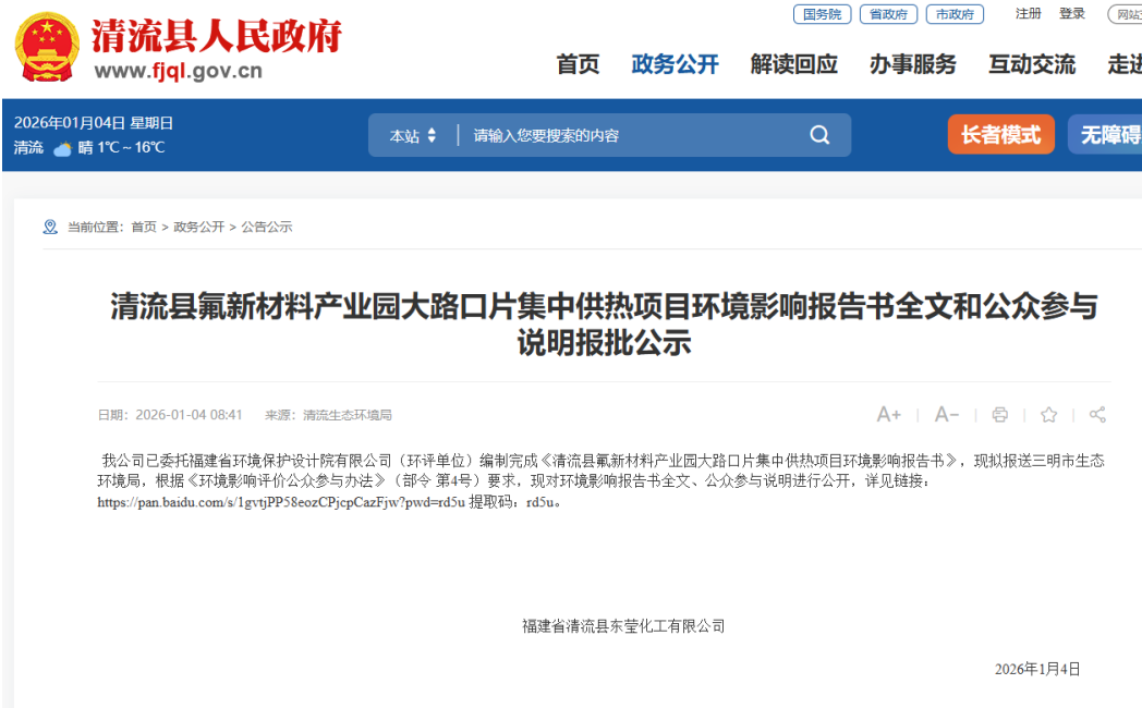
图 6.1-1 报批前网络公示