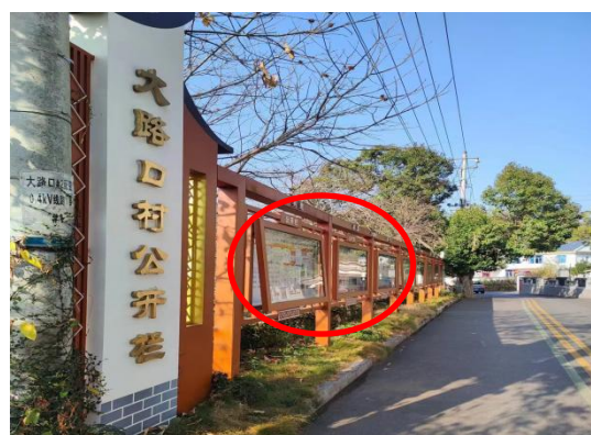
嵩溪镇人民政府、大路口村