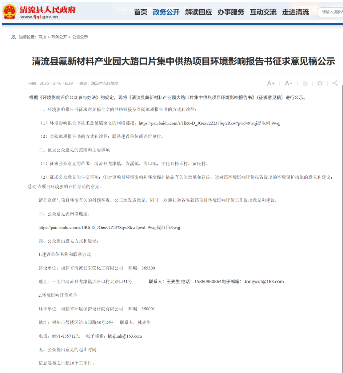
图 3.2-1 第二次公示网络截图