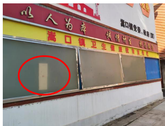
龙津镇、嵩口镇人民政府