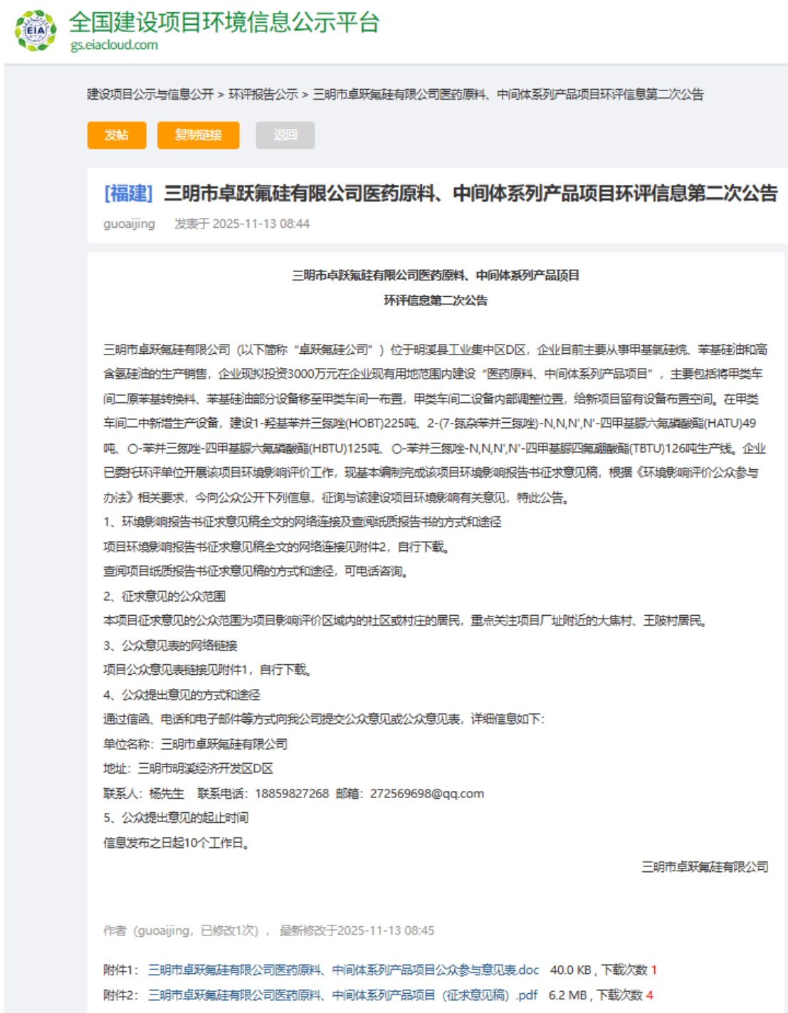
图 1 征求意见稿网络公示截图

项目环境影响报告书征求意见稿网络公示选择在全国建设项目环境信息公示平台（ https://www.eiacloud.com/gs/detail/1?id=51113458Eg ）上进行，公示期为 10 个工作日（2025/11/13~2025/11/），公示截图详见图 2。