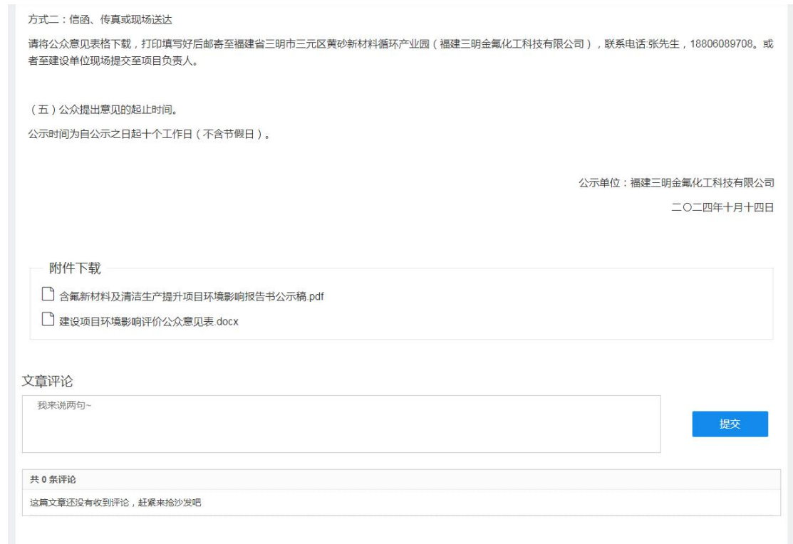
图 3.2-1 第二次网络公示截图