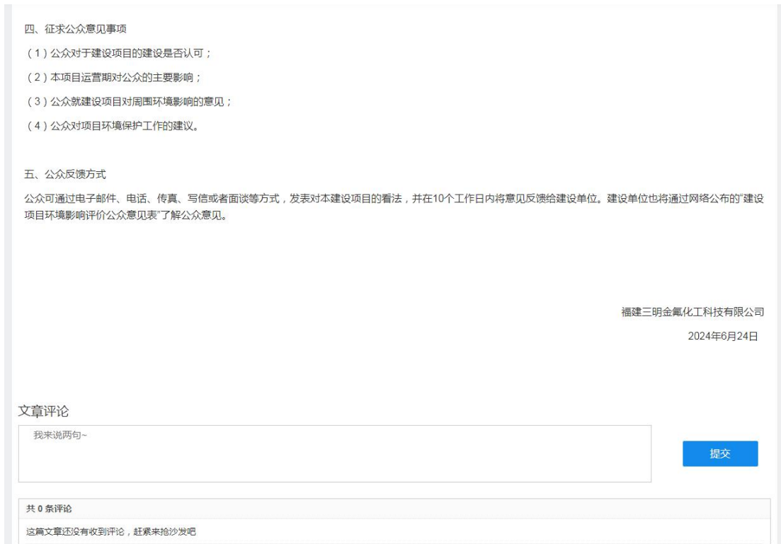
图 2.2-1 第一次网络公示截图