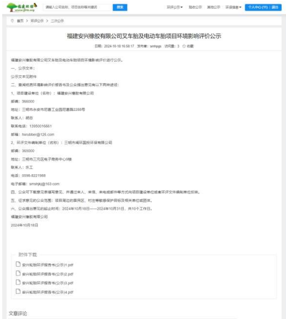
图 4-3 全文本公示网络公示

建设单位于2024年10月18日在“福建环保网”(网址: https://www.fjhb.org/ )进行了公示, 公示截图见图 2-3。