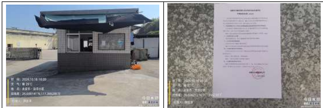
图 4-4 广告栏公示信息