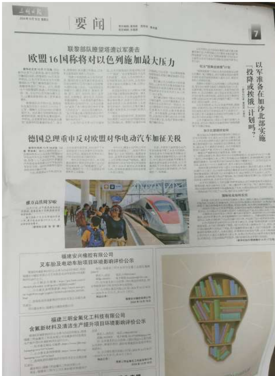
图 4-1 全文本公示第一次报纸刊登照片（2024. 10. 18）