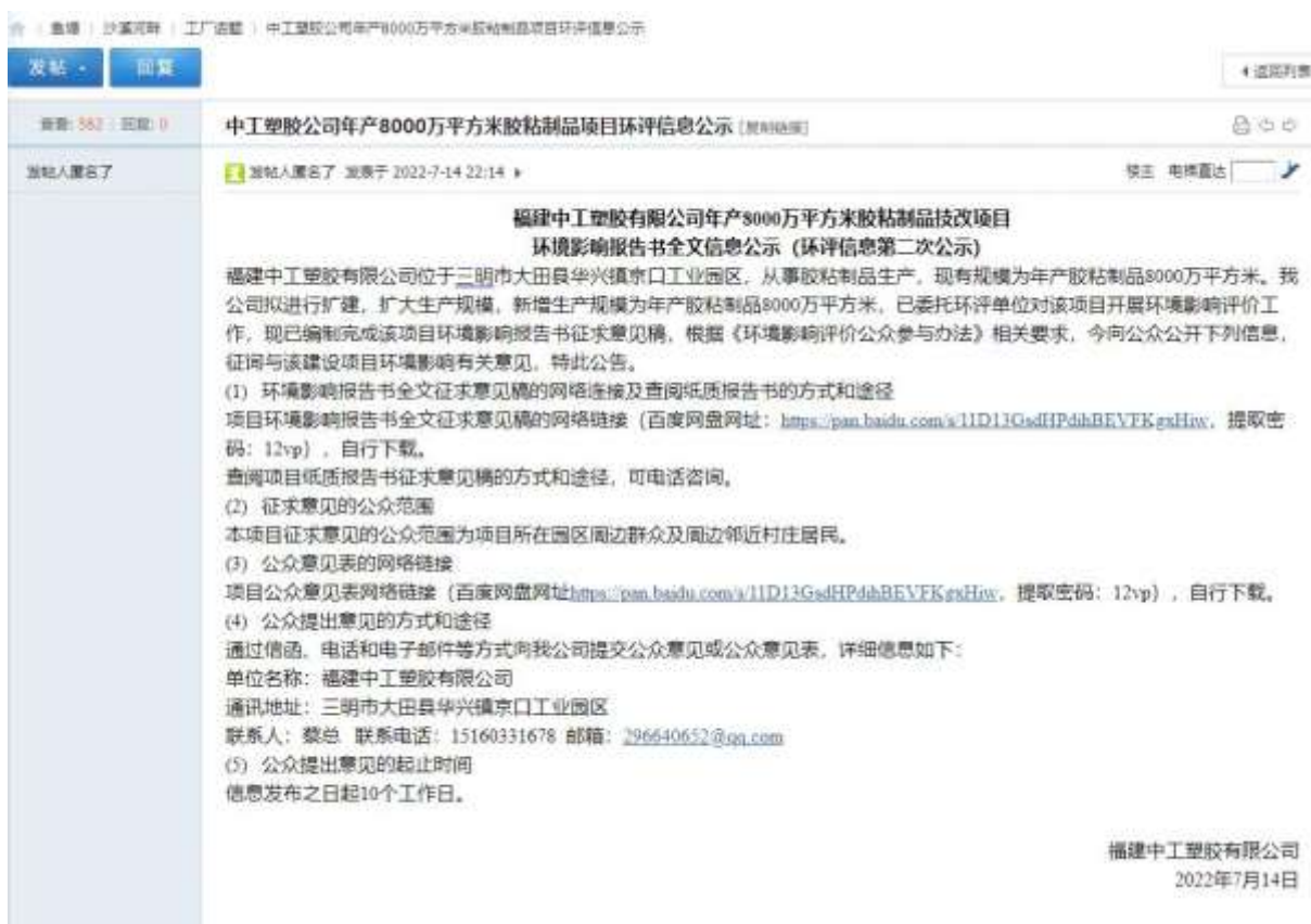
图 3-1 项目第二次环境信息网络公示截图

三明鱼网为三明市当地网络信息公开网站，作为项目公示网络平台，符合《环境影响评价公众参与办法》关于网络公示媒介的要求。