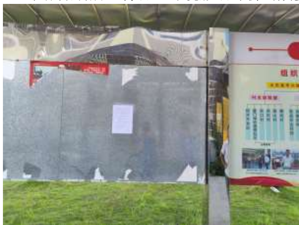
京口工业区管委张贴照片

京口工业区管委会、京口村村委会，是项目所在地公众于知悉的场所，作为项目公示张贴场所，符合《环境影响评价公众参与办法》关于张贴场所的要求。