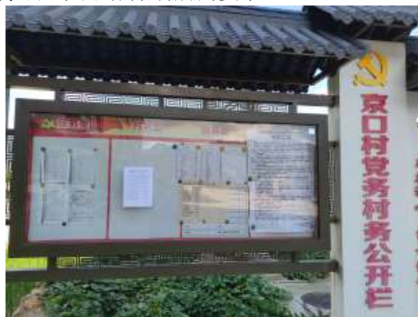
京口村村委会张贴照片