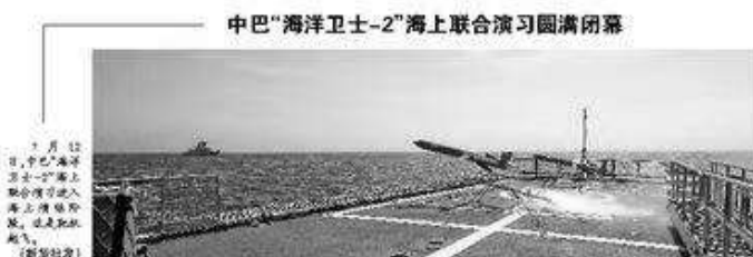
中巴“海洋卫士-2”海上联合演习圆满闭幕

在流域区域协同发展、生态优先、绿色发展、经济社会全面绿色转型、人与自然和谐共生、文化繁荣兴盛、人民生活富裕、社会治理效能全面提升、民生福祉持续改善、生态环境持续改善、生态文明建设取得重大进展、生态文明建设取得重大进展、生态文明建设取得重大进展。