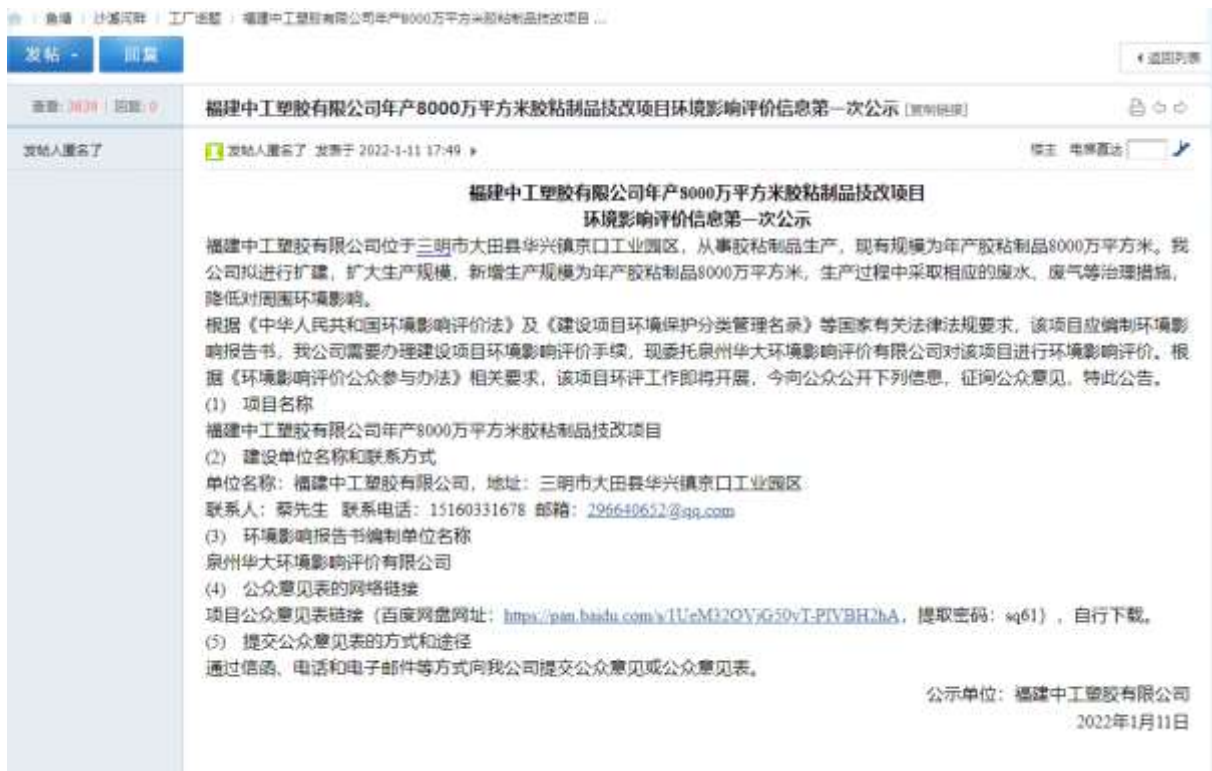
图 2-1 项目第一次环境信息网络公示截图