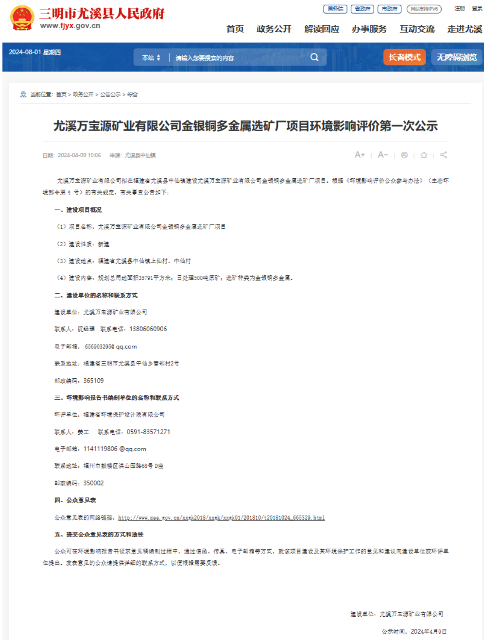
图 2.2-1 本项目网络平台第一次公示截图