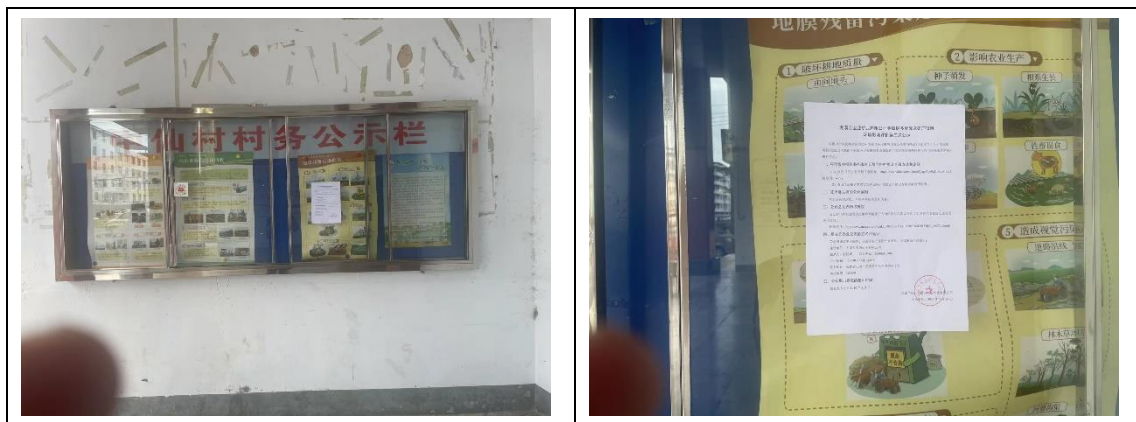
图 3.2-5 中仙村民委员会公示栏现场张贴照片