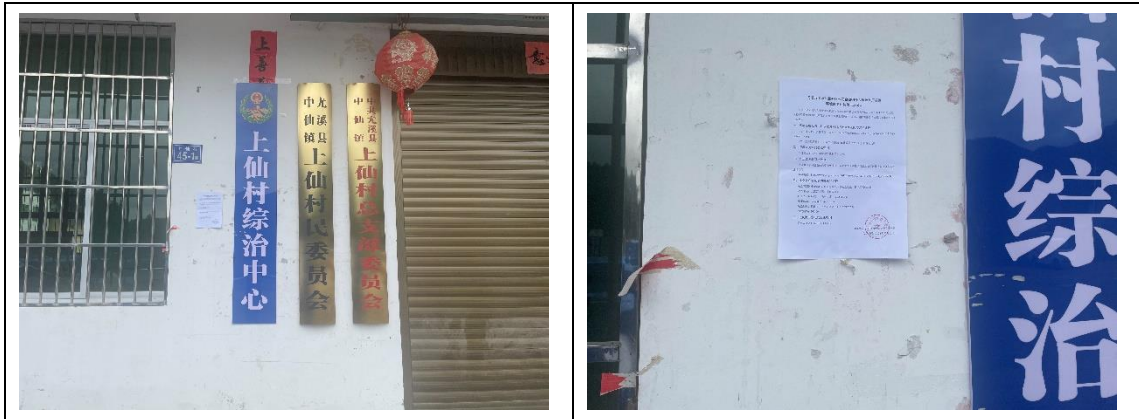
图 3.2-6 上仙村民委员会现场张贴照片