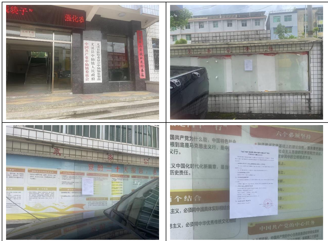
图 3.2-4 中仙镇人民政府现场张贴照片

本次现场张贴按照《环境影响评价公众参与办法》的“第十一条第三款”要求，在建设项目所在地公众易于知悉的场所张贴公告的方式公开，且持续公开期限不得少于10个工作日。本项目于2024年7月24日-2024年8月6日10个工作日，在中仙镇人民政府、中仙村民委员会和上仙村民委员会办公点进行了现场张贴公示，现场张贴照片如下图 3.2-4~图 3.2-6。