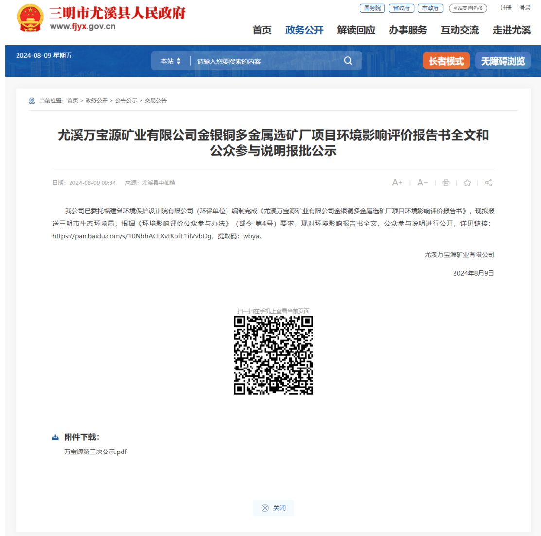
图 3.4-1 本项目网络平台第三次公示截图