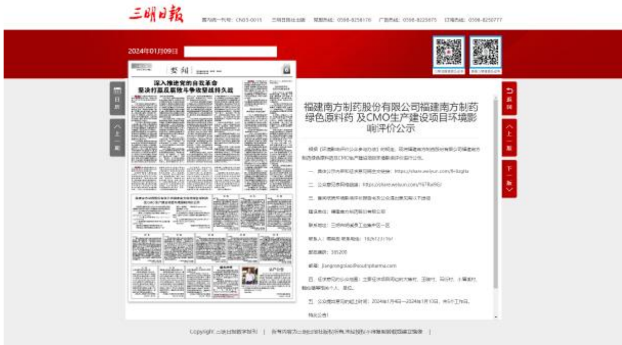
图 3.2-2 项目环境影响报告书征求意见稿报纸公示截图